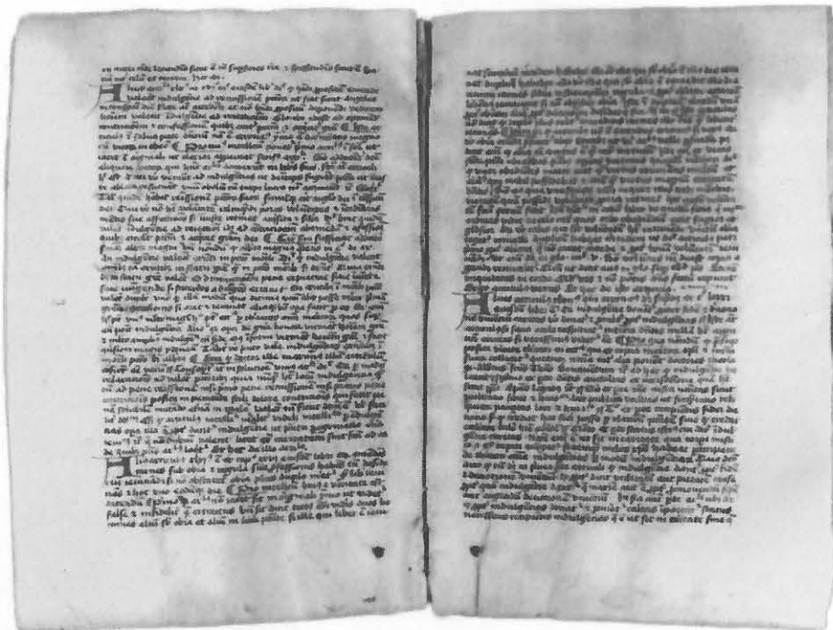
Handskrift på pergament. Defensorium 1456.- Bibliotheca Birgittina